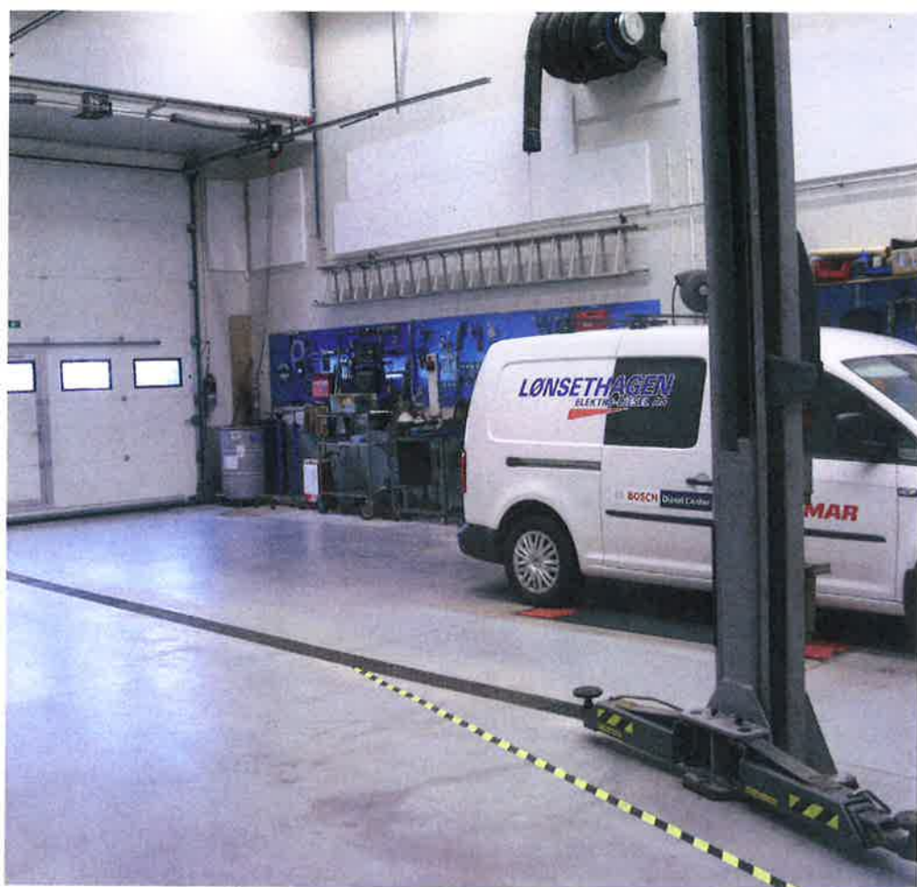
Lønsethagen i Molde har et komplett verksted med plass til både store og små kjøretøy, innredet etter spesifikasjoner fra Bosch.

moderne utstyret og har en stjerneposisjon innen Bosch diesel.